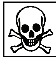
T+ - sehr giftig T - giftig und/oder krebserzeugend